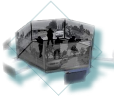
Simulador IVR 360°